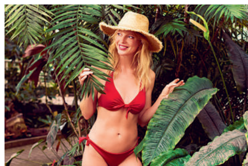
Součástí kolekce jsou i doplňky – náušnice, slamáky, plážové tašky aj.